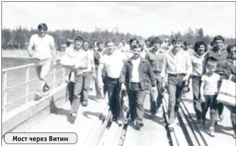
Мост через Витим