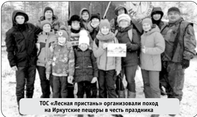
ТОС «Лесная пристань» организовали поход на Иркутские пещеры в честь праздника

По меркам нашей огромной страны Муйский район небольшой, но он вносит свой достойный вклад в ее развитие. И главная его гордость и ценность - живущие здесь люди, трудолюбивые, нацеленные на успех, не пасующие перед трудностями, упорно созидающие в будни и замечательно отдыхающие в праздники. Муйский район для жителей - не просто место жительства. Это общий дом, объединяющий людей разных судеб, характеров, поколений в единое целое. С благодарностью вспоминаем тех, кто стоял у истоков основания района. Преклоняемся перед земляками, которые сражались на фронтах всех войн, отстаивая свободу и независимость Родины. Гордимся трудовыми подвигами