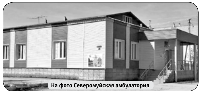
На фото Северомуйская амбулатория

все же посетят район. (Сегодня, 10 сентября, они прибыли в Северомуйск, затем поедут в Усть-Муе, 11 сентября пройдет встреча с активом района, руководителями организаций в ДК «Верас» п. Таксимо. Подробнее об этом читайте в следующем номере газеты).