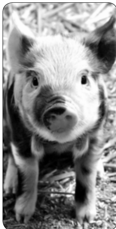
ского района. Для того, чтобы предупредить данную болезнь,

Несмотря на все принимаемые меры по недопущению распространения данных заболеваний существует реальная угроза их заноса на территорию Муй-