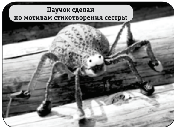
Паучок сделан по мотивам стихотворения сестры

Я восхищенно разглядываю игрушки, расставленные на полочках, развешенные по стенам: смешные свинки,