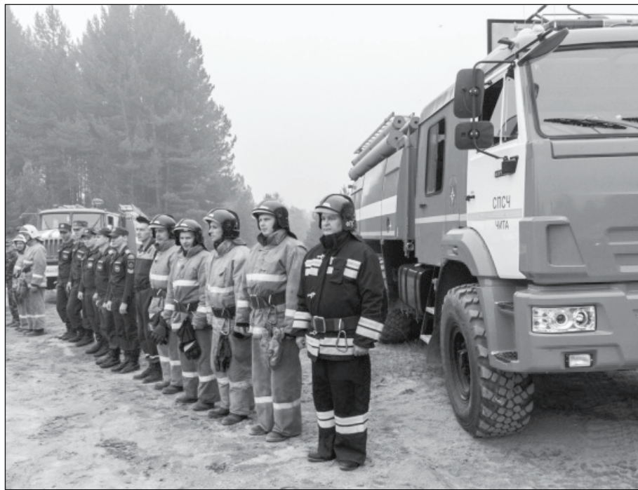
Пожарные расчеты МЧС РФ по РБ обеспечивают безопасность поселений в условиях лесных пожаров.

С 1 января 2017 года на территории Бурятии сотрудники Республиканского агентства лесного хозяйства, МВД по РБ,