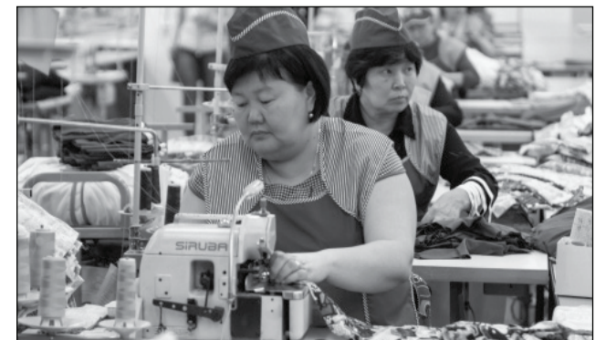
Предприятие «Ажур-Текс» — один из резидентов Промышленного парка.