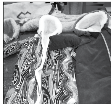
Господдержка позволила ООО «МИП «ЭКОМ» создать полный цикл по переработке овчины.