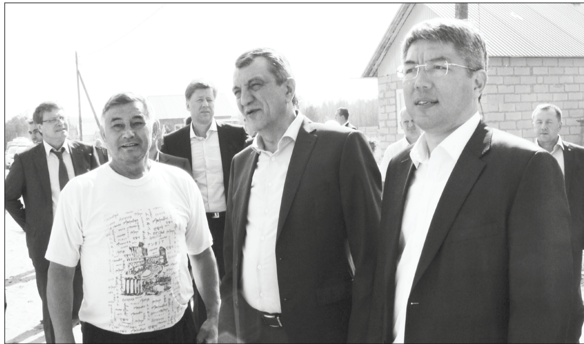
Полномочный представитель президента России в СФО Сергей Меняйло и исполняющий обязанности Главы Бурятии Алексей Цыденов проверили, как идет строительство домов после пожара в селе Черемушки

Благодаря оперативным действиям правительства Бурятии и лесной охраны ситуация с пожарами в регионе остается под контролем. В текущем году возгорания тушатся в четыре раза быстрее