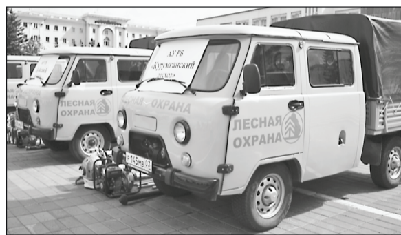
Лесопатрульные машины уже помогают тушить пожары в лесах Бурятии