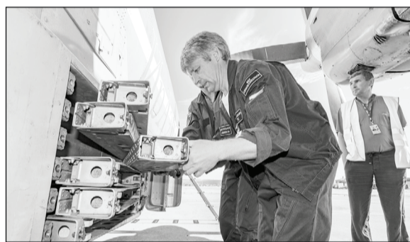
Закладка пиропатронов в самолет АН-26 для искусственного вызова осадков