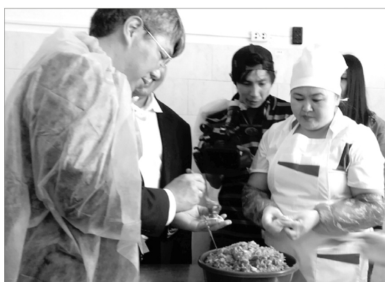
Исполняющий обязанности Главы в СПК «Баян»