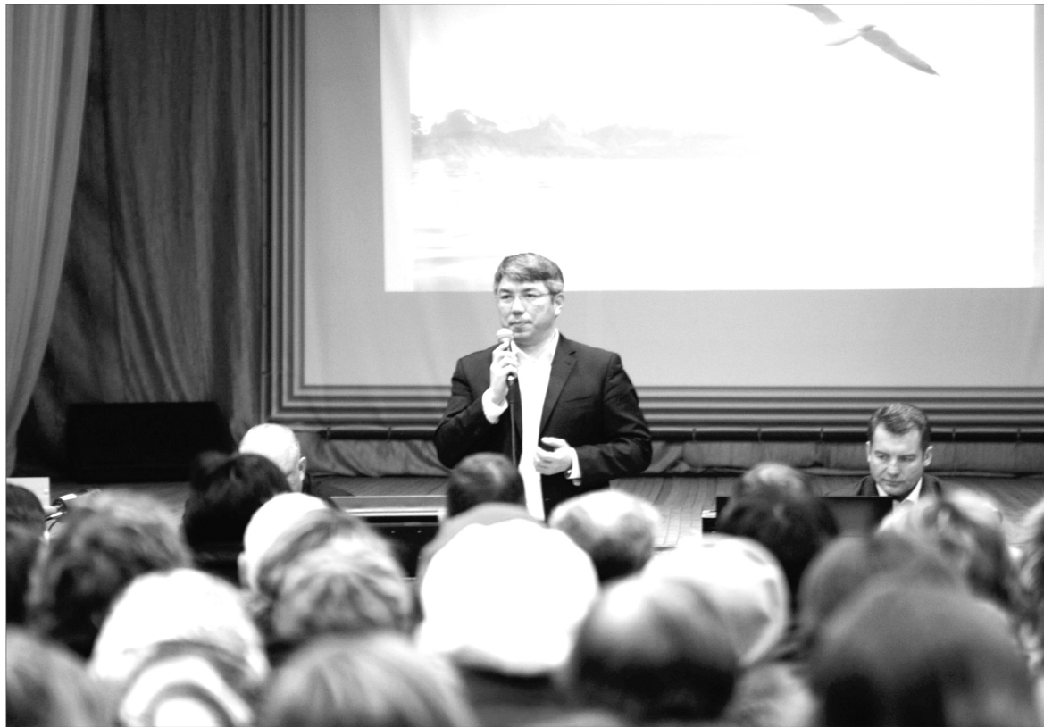
Встреча с жителями северных районов.

— Приоритет надо отдавать нашим, собственным производителям продуктов. Чтобы не красное мясо молоко закупалось или новосибир-