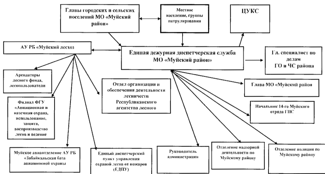
СХЕМА оповещения в случае возникновения ЧС, обусловленных лесными пожарами

Приложение № 2 к постановлению администрации муниципального образования «Муйский район» № 18 от 26.03.2018г.